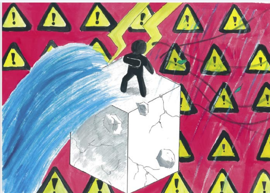
Фото: Хватит ли у Вас Запасов и Продуктов?

По случаю этого Международного Дня МСССБ/ООН, ЮНИСЕФ и Международная Федерация Обществ Красного Креста и Красного Полумесяца (МФКК) провели пресс-конференцию в Женеве, в ходе которой подчеркивалась важность изучения и преподавания вопросов, связанных с сокращением риска от стихийных бедствий, а также было объявлено о начале распространения настольной игры и видеофильма под названием “Страна Риска”. Созданная совместно ЮНИСЕФ и МСССБ/ООН, эта игра учит участников тому, что можно сделать, чтобы снизить воздействие стихийных бедствий. Игра построена в форме ответов на вопросы, задаваемых участнику по мере его продвижения по извилистому маршруту на игровой доске. В настоящее время игра переводится на более чем 35 языков мира.