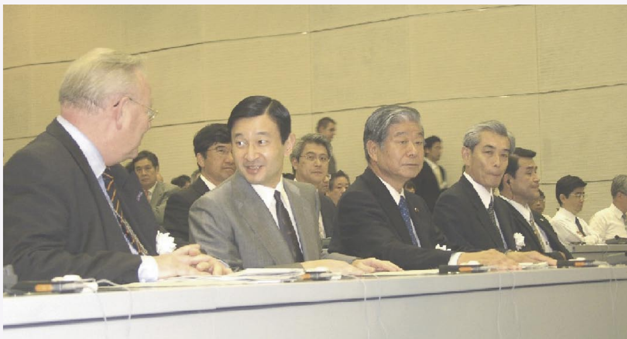
Фото: Общественный форум “Восстановление после катастрофических стихийных бедствий - путь к более безопасному для всех миру”

24 августа 2004г. в ознаменование Дня Предотвращения Стихийных Бедствий (1 сентября) и недели Предотвращения Стихийных Бедствий (30 августа - 5 сентября) в Университете ООН (УООН) в Токио был проведен общественный форум “Восстановление после катастрофических стихийных бедствий - путь к более безопасному для всех миру”. Форум был организован совместно УООН, Правительством Японии, МСССБ/ООН, ПРООН и АЦССБ в сотрудничестве с Американским Агентством Международного Развития, ННК и администрацией Префектуры Хиого. Это мероприятие было третьим из серии форумов, проведенных совместно с УООН, Правительством Японии и другими партнерами: первый форум по управлению риском от землетрясений состоялся 4 октября 2003г., а второй - посвященный управлению риском от наводнений, был проведен 23 марта 2004г.