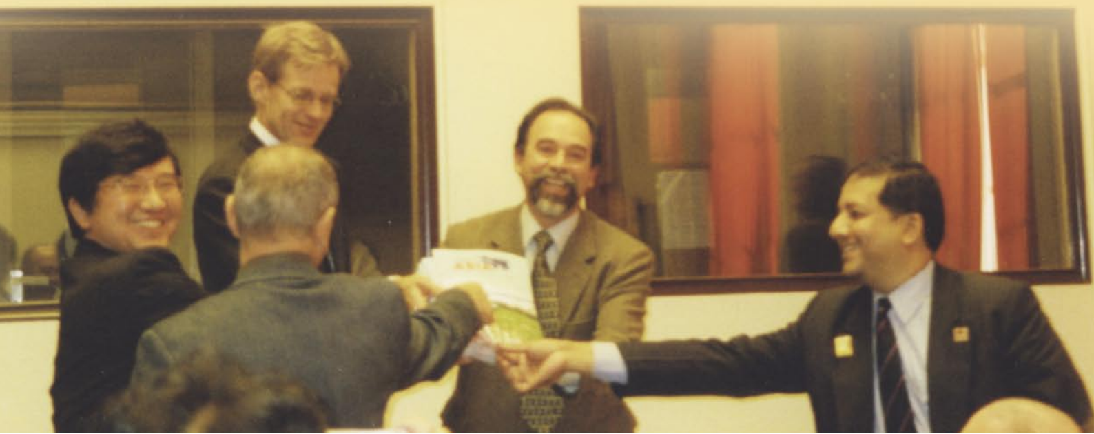
Фото: Ян Игланд, Председатель Межведомственной Рабочей Группы по Сокращению Стихийных Бедствий на официальной церемонии начала работы “Бюллетеня МСССБ - Сокращения Стихийных Бедствий в Азии”

Будучи результатом работы Азиатской Программы, Партнерства МСССБ, “Сокращение Стихийных Бедствий в Азии - Бюллетень МСССБ” представляет собой возможность укрепления регионального диалога по сокращению риска от стихийных бедствий. Пользуясь этой возможностью, я хочу поблагодарить наших партнеров за поддержку и сотрудничество.